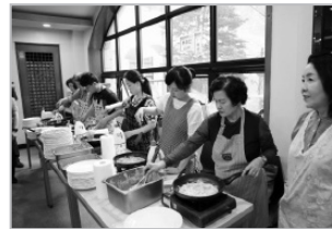
맛의 향연장, 바자회!