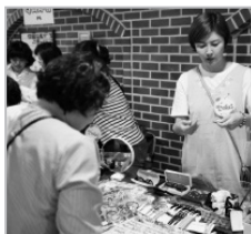
예쁜 악세사리가 가득!