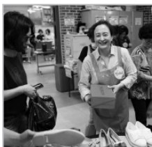
행복이 가득한 바자회!