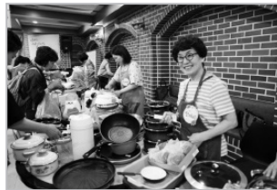
기쁨을 나누는 바자회!